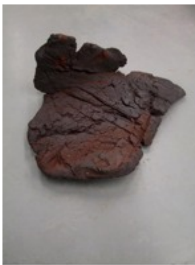
rien de terre, 2008, grès rouge chamotté, cuisson au four à bois, 60-40-25cm.