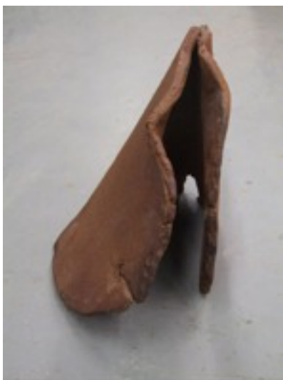
Sans titre, 2008, grès rouge chamotté, 45-30-18cm.

Ce n'est plus de la terre cuite, mais une pièce qui appelle le spectateur, fait appel à sa perception, oriente son corps, dirige son regard.