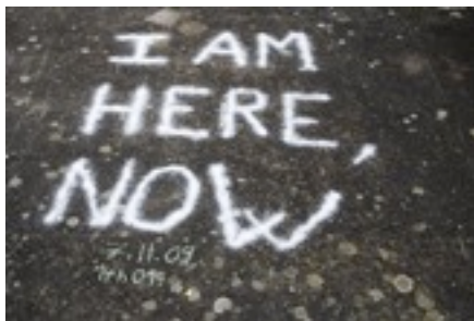
I am here, now, 2009 performance le 7 novembre, groisil de cristal.