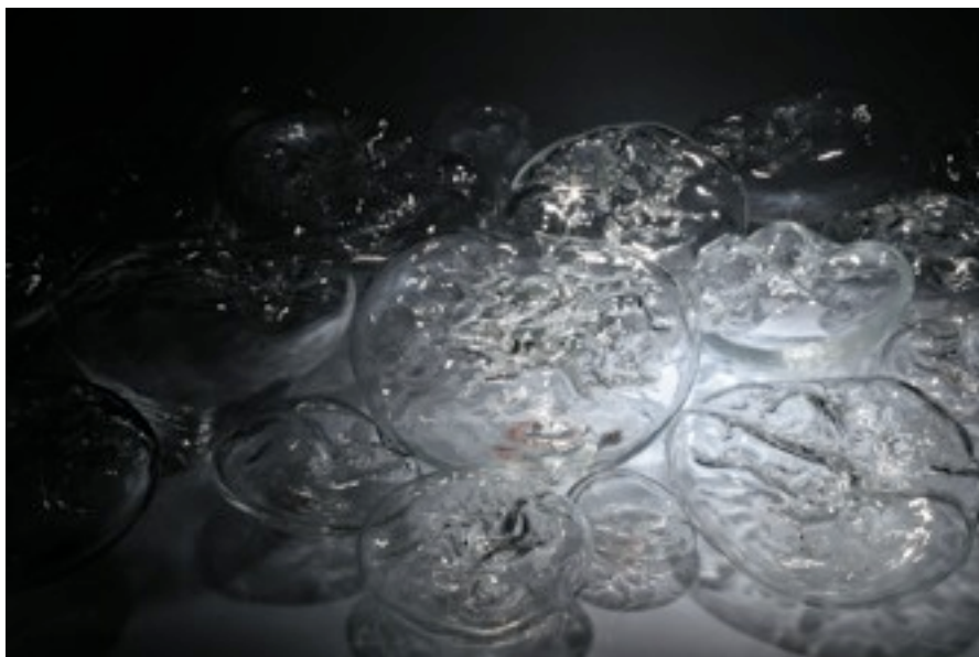
Au sol 2009-2010 dimensions variables cristal soufflé

Je souffle du verre sur cette surface, je prends l'empreinte du lieu. Traces, empreintes, qui l'inscrivent dans une réalité lointaine, un souvenir. La finesse, la transparence du verre ne le font disparaître qu'un peu plus. Il se confond avec l'air.