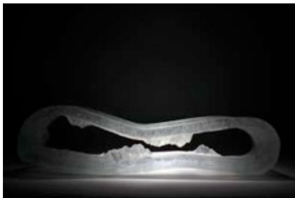
Courbe d'horizon 2009 66x18x16 cm pâte de verre