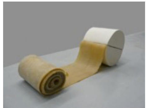
Logohrée, 2008, céramique, colorant, laine, 25 x 18 x 19 cm