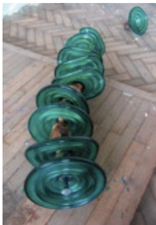
Mythologie électrique 2008 environ 200x26x26 cm