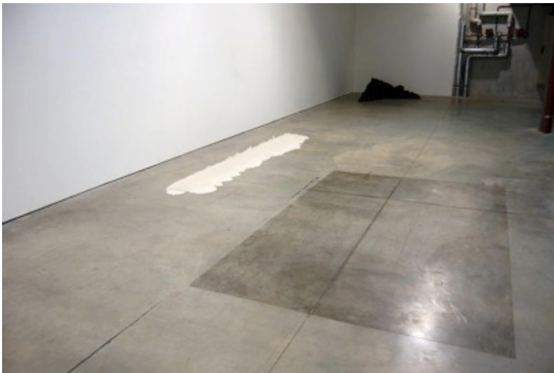
Installation réalisée à l'Ecole Nationale Supérieure d'Art de Limoges, juin 2008.