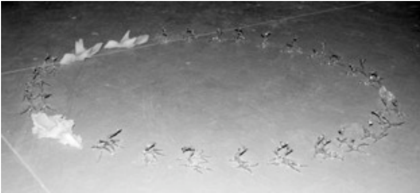
Ronde, Série Bird Parts, 2009, pyrex et cristal.

Dans l'action nous sommes présents au monde par le corps, et, dans la réflexion nous sommes par le corps et la pensée concentrés en nous-même. Quand il y a une lutte entre ces deux parties d'un même être, et qu'elles influent l'une sur l'autre, il naît alors un chaos. Ces moments de faiblesse sont la base de mon travail d'écriture et de mon travail plastique. Cette faiblesse, je la trouve belle, elle est toujours ambivalente, pour moi c'est un matériel.